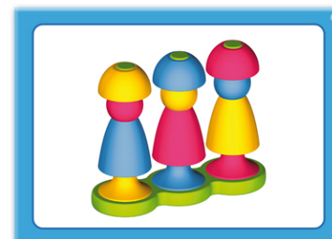
4 - Série bleue