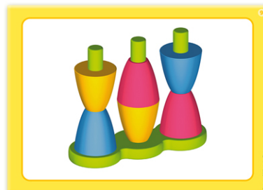
3 - Série jaune