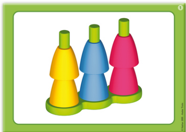
1 - Série verte