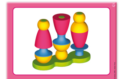
5 - Série rose