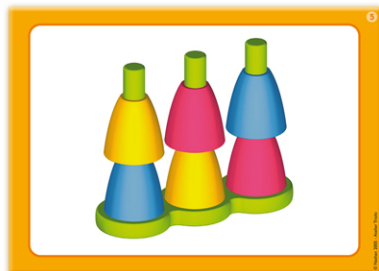
2 - Série orange